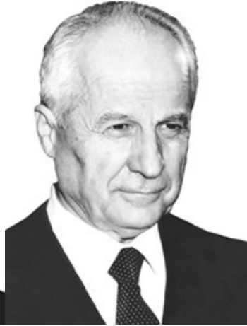
KENAN EVREN 1982-1989