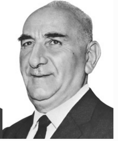
CEMAL GÜRSEL 1960-1966