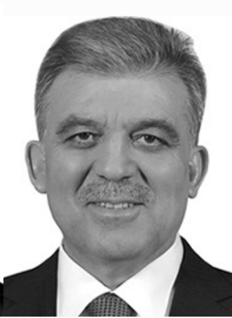
ABDULLAH GÜL 2007-2014