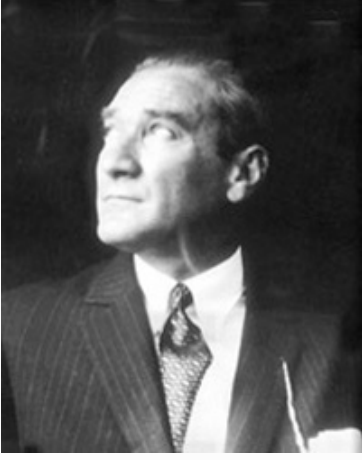
M. KEMAL ATATÜRK 1923-1938