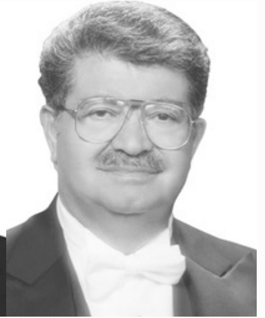
TURGUT ÖZAL 1989-1993