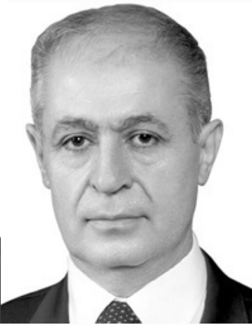
A. NECDET SEZER 2000-2007