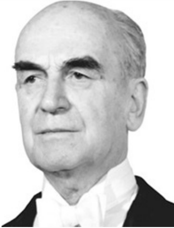
FAHRİ KORUTÜRK 1973-1980