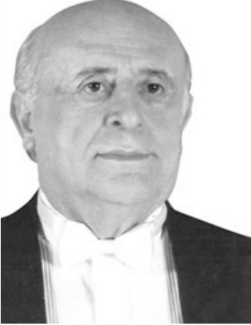
SÜLEYMAN DEMİREL 1993-2000