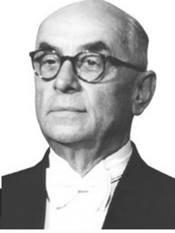
CELAL BAYAR 1950-1960