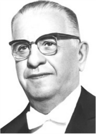
CEVDET SUNAY 1966-1973