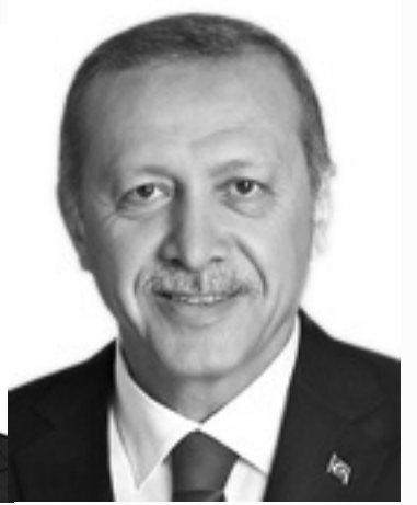
R. TAYYİP ERDOĞAN 2014-